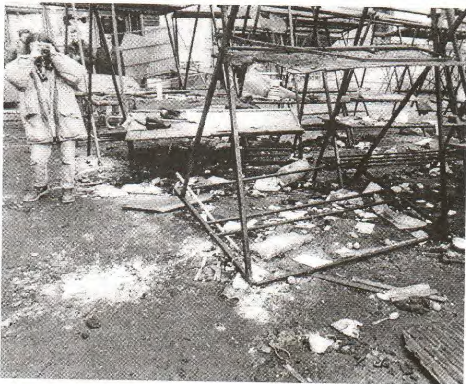
MARKALE - MJESTO GDJE JE EKSPLODIRALA AGRESORSKA GRANATA, PRIČINIVŠI NAJTEŽI MASAKR U SARAJEVU OD POČETKA AGRESIJE.