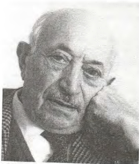
Pokrovitelj Kongresa počasni dr. nauka Simon Vizental (Simon Wiesenthal) direktor Jevrejskog dokumentacionog centra u Beču