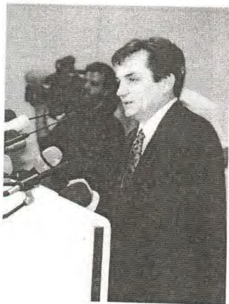
U ime pokrovitelja Alije Izetbegovića Kongres je pozdravio dr. Haris Silajdžić, predsjednik Vlade Republike Bosne i Hercegovine