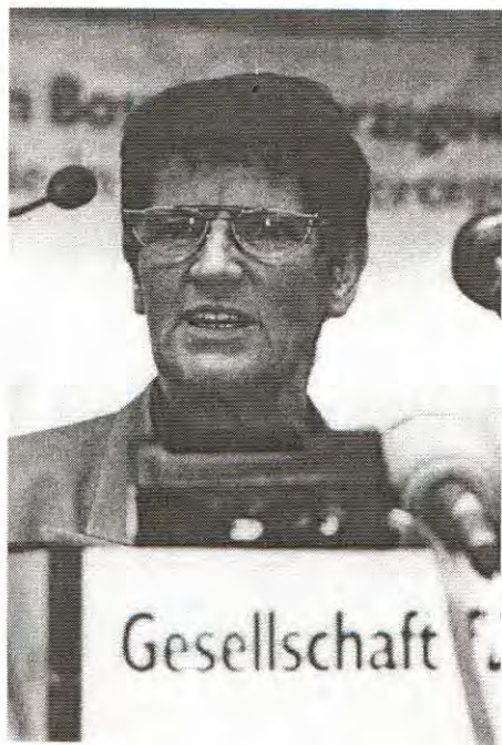
Pokrovitelj Kongresa prof.dr. Rita Zismut (Rita Süßmuth), predsjednik Parlamenta Savezne Republike Njemačke