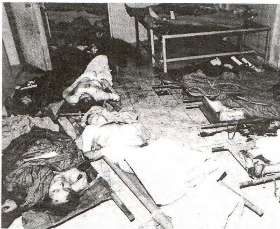
MRTVAČNICA NAKON MASAKRA NA PIJACI MARKALE - SARAJEVO, 5. FEBRUAR 1994. AGRESOR JE UBIO 67 I RANIO OKO 200 CIVILA.

Pored već ostvarenih strateških uspjeha, koji se, prije svega, ogledaju u sprečavanju agresora da ostvari efektivnu okupaciju zemlje i posebno planirano uništenje Bošnjaka i njihovih tekovina, strateški ciljevi u narednom periodu su konačno oslobođenje preostalih okupiranih teritorija, čime bi definitivno bio zaustavljen svaki teror.