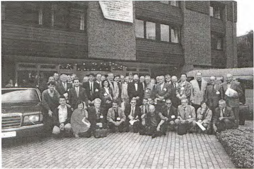
Učesnici Kongresa iz Bosne i Hercegovine pred zgradom Instituta "Gustav Streseman" u kojoj je Kongres održan