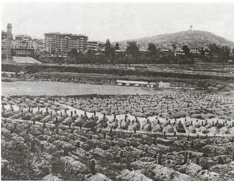
GROBLJE "LAV" U SARAJEVU. NEKADA SU NA MJESTU DONJEG DIJELA GROBLJA BILI SPORTSKI TERENI.