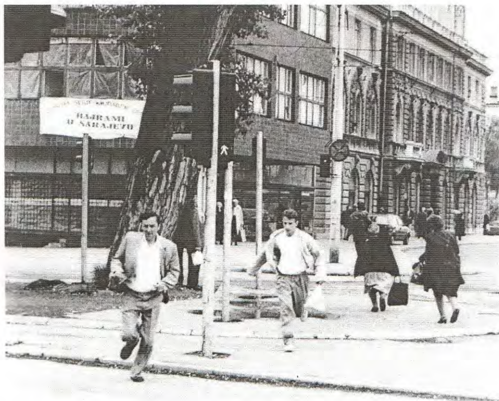
UOBIČAJENI DETALJI SA ULICA SARAJEVA. NA OVOJ RASKRSNICI AGRESOR JE SNAJPERIMA UBIO I RANIO VELIKI BROJ CIVILA.

Promjenom svoje politike i odnosa prema agresiji na Bosnu i Hercegovinu Međunarodna zajednica bi povratila izgubljeni kredibilitet i moralno-politički dignitet, a Bosni i Hercegovini bi uštedjela dalja stradanja, nove žrtve i omogućila pravedan i brz završetak rata.