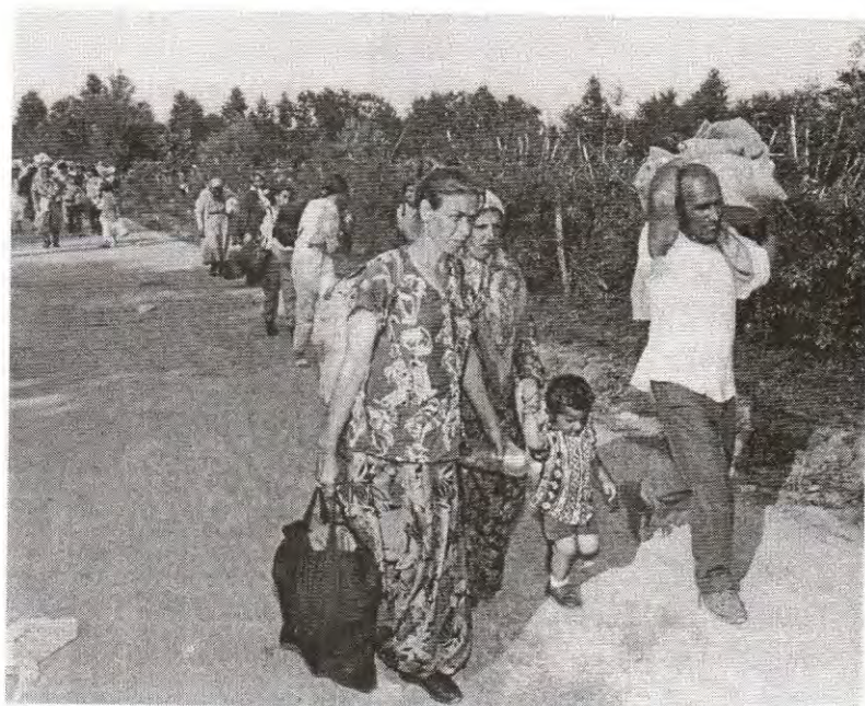
KOLONA PROGNANIH SREBENIČANA NA PUTU PREMA AERODROMU DUBRAVE KOD TUZLE (JULI 1995.)