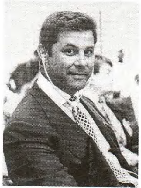
Džem Bojner, industrijalac i političar iz Turske