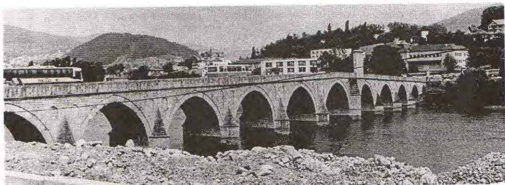
Višegradska ćuprija je i u proteklom ratu bila klaonica Bošnjaka - muslimana.