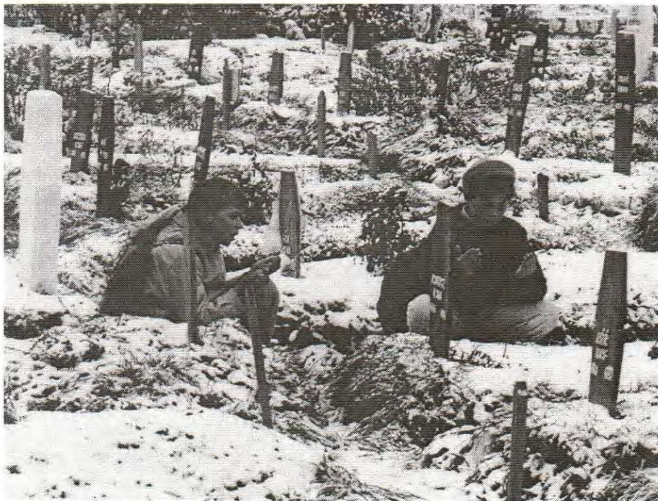
NA OČEVOM GROBU. ŠEHITSKO GROBLJE NA KOVAČIMA - SARAJEVO.

U jednim sarajevskim novinama ("Stećak") mogli smo pročitati zapis: "Majka stoji pred svježim grobom i pita: „Za čiju si stranu poginuo, sine? Na čijoj je strani Bog? Zar naš i njihov Isus nisu isti?". I u ovom ratu pokazalo se kao da "bogovi reže jedan na drugoga" (Miroslav Krleža). Jedan čuva Srbe, drugi Hrvate, treći Bošnjake.