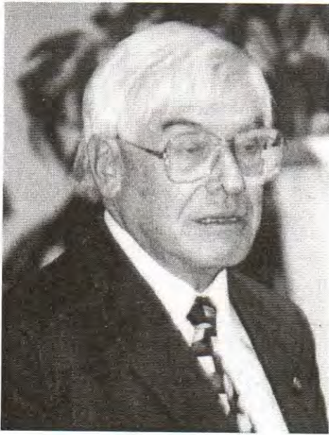
Dr. Kristijan Švarc Šiling (Christian Schwerz-Schilling), ministar Vlade SR Njemačke u ostavci