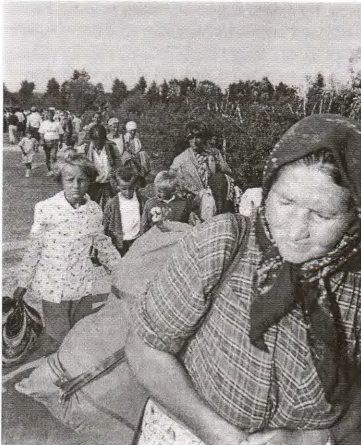
JEDNA OD BROJNIH KOLONA PROGNANIH BOŠNJAKA IZ SREBRENICE KOJU SU UN PROGLASILE ZAŠTIĆENOM I DEMILITARIZOVANOM ZONOM, A ONDA JE IZRUČILE SRBIJANSKO- CRNOGORSKOM AGRESORU. (JULI 1995.)

- Dana 8. decembra 1994. (oko 15,25 sati) minobacačkom granatom ispaljenom sa Poljna na Livanjsku ulicu agresor je ubio 3, a teže ili lakše ranio 4 civila, većinom djecu.