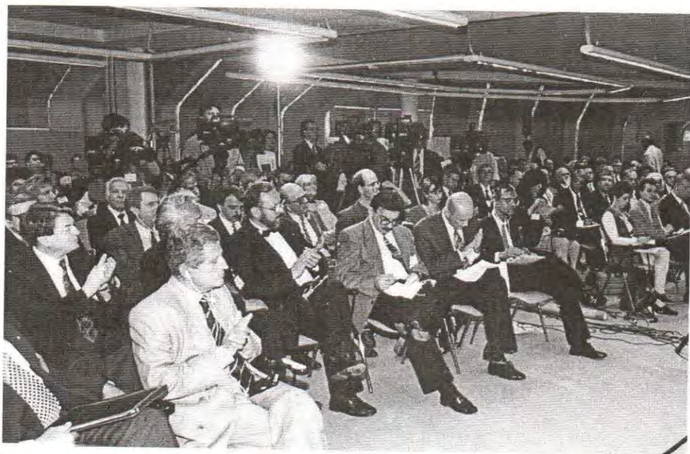
Učesnici Kongresa su sa pažnjom saslušali više od 100 referata i diskusija