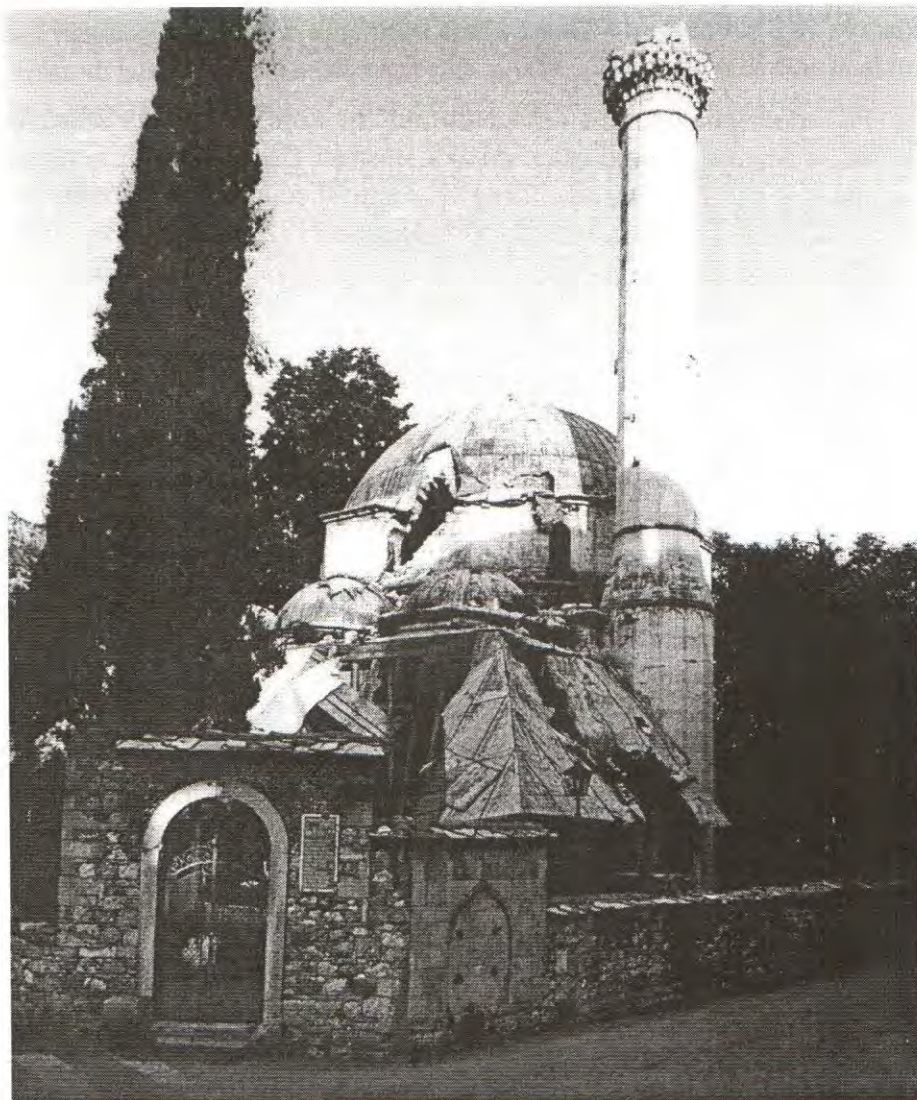
KARADŽEBEGOVA DŽAMIJA U MOSTARU PREDSTAVLJALA JE VRHUNAC ISLAMSKEGRADITELJSTVA

bošnjačkoj mjesnoj zajednici, jednako s drugim mještanima, svakodnevne poslove. Ne, nema nikakva čuda u tome. U Bosni su čuda druge naravi. Dakle, iako rat još bjesni i traje agresija, u slobodnim dijelovima Bosne ovaj primjer je normalna stvar. Jer, tamo teče normalan ljudski život, u kome mogu i idu zajedno i sila, i pravda, i razum, i srce. Drugdje, nažalost, ovaj uzvišeni princip sve je ugroženiji. Kome pripada zasluga za prvi, a krivica za drugi slučaj, neka svako sam presudi.