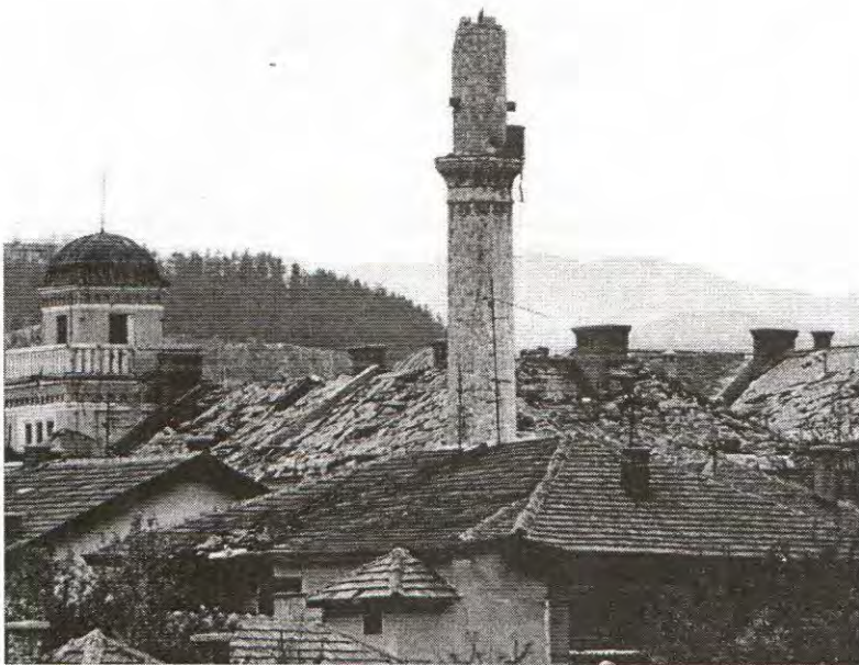
BIJELA DŽAMIJA NA VRATNIKU, SARAJEVO

Svako dijete uči da se mora čuvati vatre i noževa, jer mogu uništiti kuće i raniti ljude. Dosad se ne uči da hajka i mržnja protiv drugih grupa ljudi mogu uništiti zemlje i ubiti ljude. Zato moramo istražiti i razjasniti zločin propagande i sve njegove metode tako da svi učimo i da naučimo i našu djecu: Mržnja protiv drugih grupa je ubilačka. Ko organizira ili izvodi hajku i prodokuje mržnju protiv drugih grupa, taj je masovni ubica.