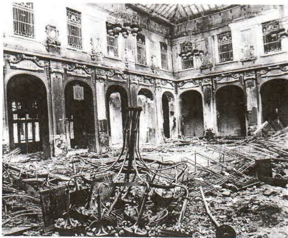
POŠTA NA OBALI - SARAJEVO. ZDANJE KOJE JE U ARHITEKTONSKOM SMISLU BILO POZNATO U SVIJETU. AGRESOR JE 2. MAJA 1992. UNIŠTIO MODERNU OPREMU SA 45.000 TELEFONSKIH PRIKLJUČAKA.

u Sekretarijatu UN, Forin ofisu (Foreign Office), Stejts Departmentu (State Department) i drugdje. Budućnost svjetskog liderstva u međunarodnim poslovima i njegovog utemeljenja u potpisanim konvencijama sada zavise od toga. Pitanje genocida u Bosni je, onda, veoma daleko od onoga da je "na krilima". Ono je, naprotiv, sasvim centralno za budućnost civilizacije bilo gdje. U stvari, naši nacionalni sudovi, kao i međunarodni, su obavezni po Konvenciji da istražuju optužbe za genocid i krajnje je vrijeme da se tačni načini izvođenja toga uspostave u svakoj zemlji. Za Britaniju, mogućnost kažnjavanja čak i najveće političke moći je bila vijekovima centralna u našem nacionalnom samorazumijevanju. Zato se na kraju Šekspirovog Henrija IV, Čin 2, Henri V prikazuje kao onaj koji hvali Vrhovni sud što ga šalje u zatvor iako je on princ od Velsa (Wels), "čovjek toliko odvažan da kuša pravdu" na princu, i traži od njega da nastavi biti "toliko odvažan, pravedan kao nepristrasni duh". Ovo takode mora biti naš apel Međunarodnom sudu za ratne zločine. On sebi ne može priuštiti da manje uradi. Fiat iustitia et ruant coeli (Nek se vrši pravda makar se i nebo oborilo).