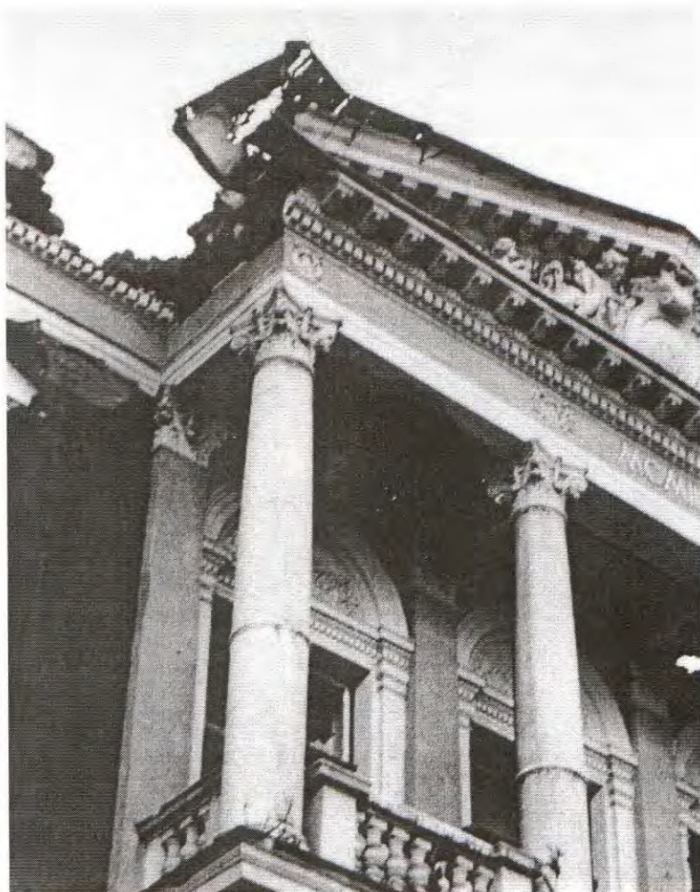
MUZEJ XIV ZIMSKIH OLIMPIJSKIH IGARA U SARAJEVU, POTPUNO UNIŠTEN AGRESORSKIM GRANATAMA