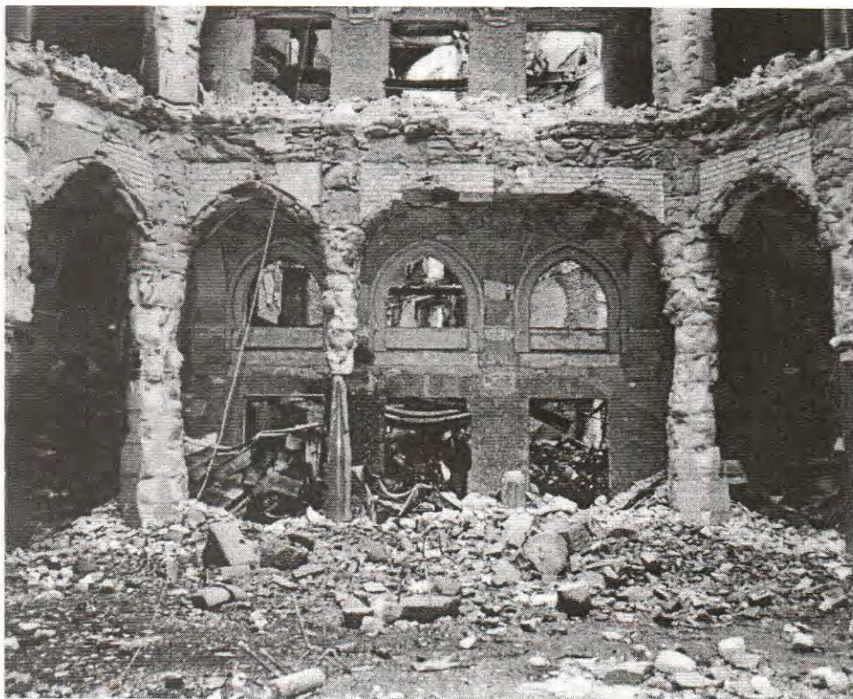
POTPUNO UNIŠTENJA GRADSKA VIJEĆNICA U SARAJEVU, IZGRAĐENA U PSEUDOMAVARSKOM STILU, U KOJOJ SE NALAZILA I UNIVERZITETSKA BIBLIOTEKA

A kada je u pitanju Kongres SAD, on će vjerovatno prihvatiti mračno stajalište o slanju američkih mirovnih snaga u takvo nestabilno okruženje.