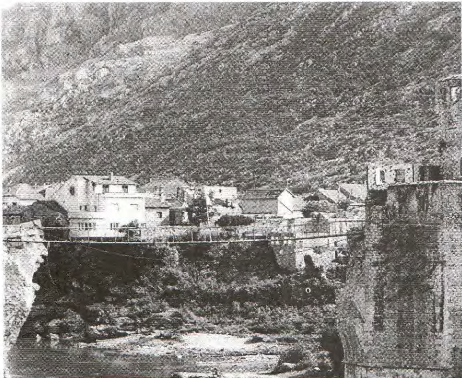
MJESTO NA KOME SE NALAZIO STARI MOST U MOSTARU, SIMBOL GRADA I JEDNA OD NAJLJEPŠIH GRADEVINA TE VRSTE U SVIJETU

Depresivno je, ali u budućnost moramo ići sa novom zastavom: "nikad ponovo". Radi toga moramo osigurati da Haški tribunal kazni genocid i one koji su odgovorni za njegovu implementaciju, a ne samo ratne zločince kao što je Dušan Tadić.