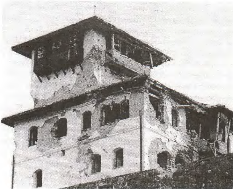
KULA HUSEIN KAPETANA GRADAŠEVIĆA U GRADAČCU, JEDAN OD KULTURNO- HISTORIJSKIH SIMBOLA BOSNE I HERCEGOVINE

Svijet baš nije u redu jer Bosna, jedna mala zemlja, je tako dugo žrtva jedne agresivne ideologije, a "međunarodna zajednica" na rat rasista i šovinista svo vrijeme odgovara ponudama za pregovore i apelima za mir. Svijet nije u redu jer Bosna i Hercegovina već dugo nije sasvim sigurna u svojim sadašnjim međunarodno-pravno priznatim granicama. Ja se bojim da je multietničko, multikulturno, multireligijsko bosansko društvo, što je gosp. Silajdžić označio kao "bosanski duh", da je sve to dugo vremena izvan naše pažnje, a možda će biti zauvijek. Uprkos tome ne postoji ni politički, ni moralni, a naročito ne razlog po osjećanju pravičnosti da se Bosna otpiše. Mi, Evropljani, "zapadnjaci", tako mnogo ponosni na naš moral i našu kulturu, smo ljude u Bosni već odavno i dobro razočarali, a isto tako bezdušno se odnosili prema njihovom povjerenju. Stoga, svijet će za mene ponovo biti u redu tek kad mi ne budemo više jadni, bijedni oportunisti kakvi smo se do sada u Bosni pokazali.