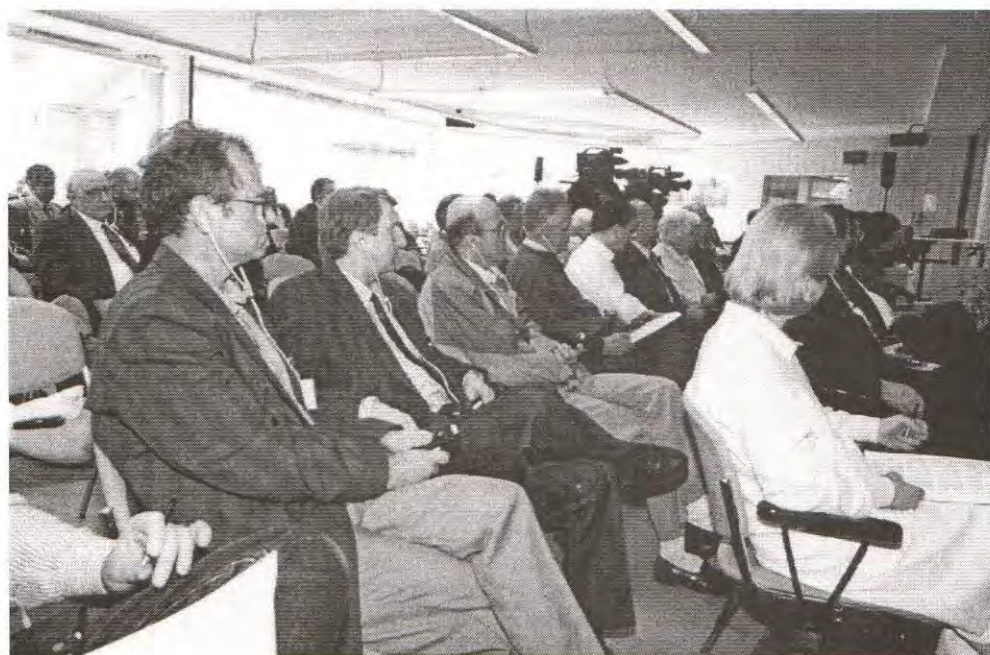
Detalj Kongresne dvorane za vrijeme izlaganja učesnika